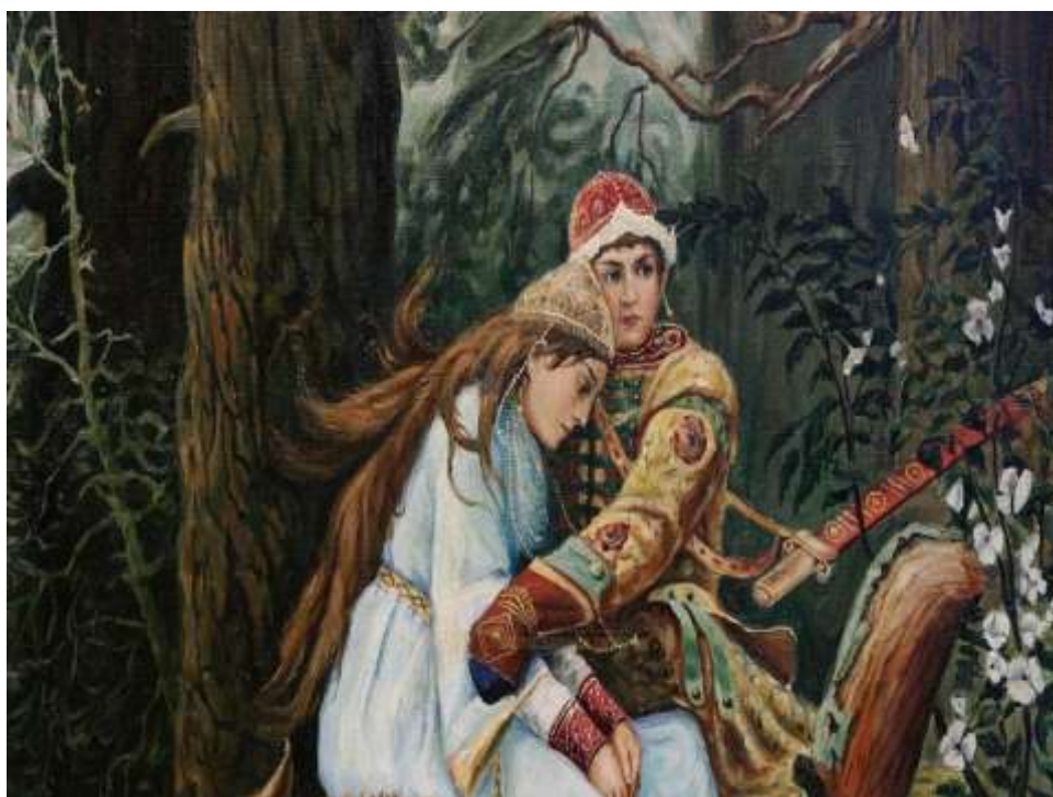
Вопросы к картине В. М. Васнецова «Иван Царевич на Сером волке»

Поэтому изучая имена прилагательные, предлагаю ученикам рассмотреть репродукции живописных картин и назвать имена прилагательные обозначающие цвета. Такая работа обогащает словарный запас, учит наблюдательности.